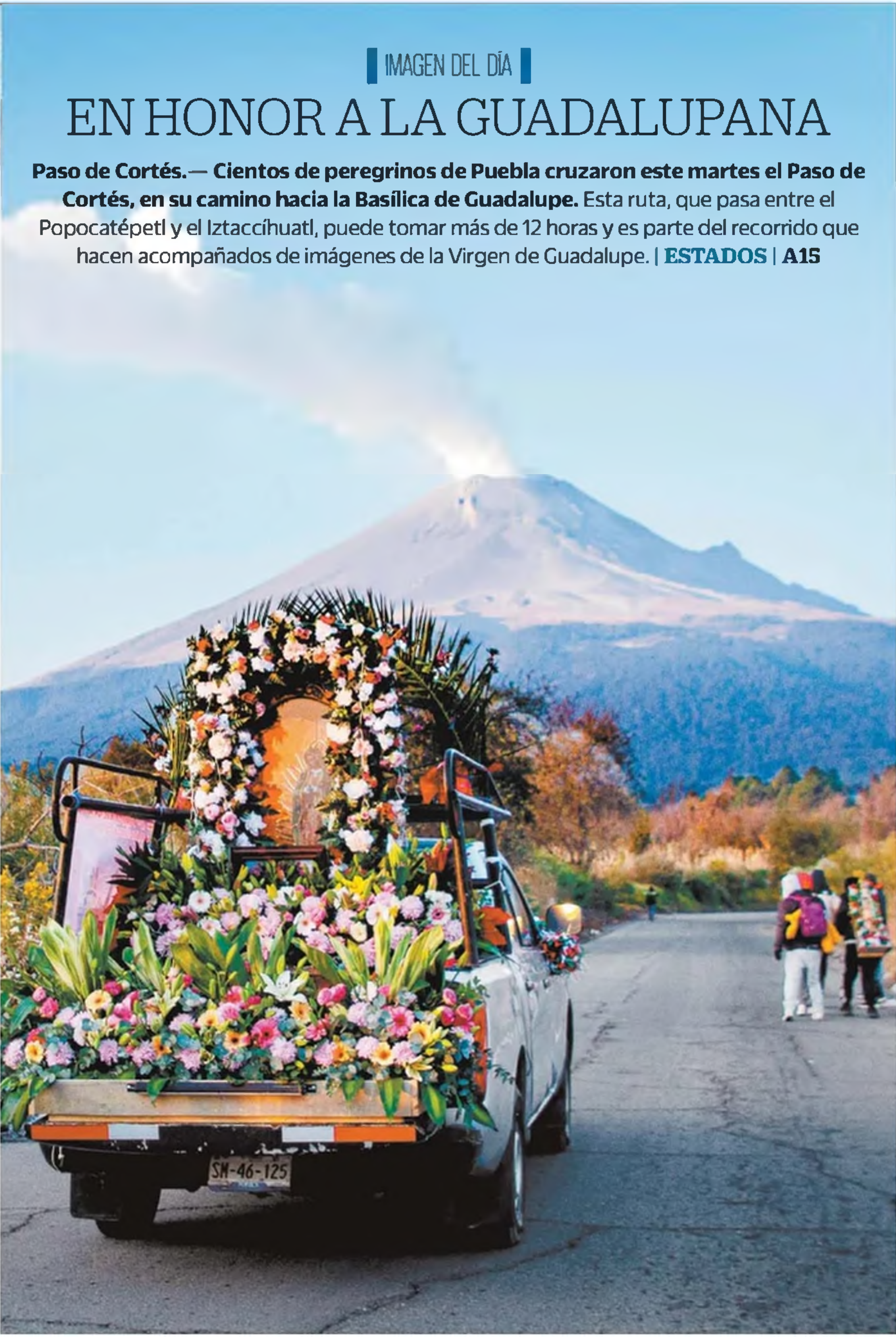
IMAGEN DEL DÍA EN HONOR A LA GUADALUPANA Paso de Cortés.— Cientos de peregrinos de Puebla cruzaron este martes el Paso de Cortés, en su camino hacia la Basílica de Guadalupe. Esta ruta, que pasa entre el Popocatepetl y el Iztaccíhuatl, puede tomar más de 12 horas y es parte del recorrido que hacen acompañados de imágenes de la Virgen de Guadalupe. | ESTADOS | A15

EL DATO Los contratos fueron para obras en complejos deportivos, sociales y de capacitación en Veracruz y Tabasco.